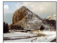
八木ヶ鼻、いい湯らてい